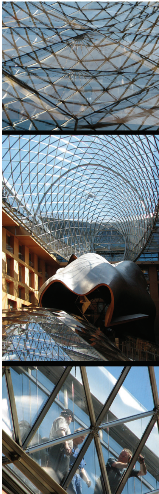
Fragmento de la serie Este – Oeste Berlín

la mecánica cuántica y, sin embargo, es imposible deducirla de un principio simple. Más bien se trata de deducir cómo debe ser una ecuación para que sea consistente con algunos hechos empíricos, y ver si funciona. ¡El mayor misterio de la mecánica cuántica es que funciona estupendamente!