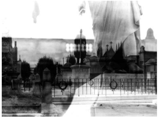
Arriba. Monumento. Obra de Orlando Salgado.

No hace mucho, ciencia y arte eran interdependientes, o mejor, la ciencia dependía de las artes. Para evidenciar lo anterior basta con recordar la Expedición Botánica en el Nuevo Reyno de Granada , liderada por el científico José Celestino Mutis, puesto que sus logros y sus hallazgos —las miles de plantas que reportó a la ciencia dicha expedición, clasificadas por Humboldt, Bonpland, Lineo y otros importantes botánicos—, fueron posibles