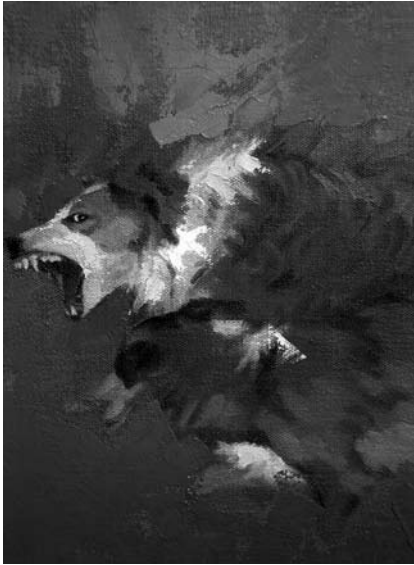
Arriba. Fragmento de una obra (en proceso) de Armando Castro Uribe.

del artista). Los principales productos de la investigación en artes son las obras, sin embargo y dentro de la lógica de la racionalidad científica, también se obtienen los documentos de registro, análisis y fundamentación conceptual, que acompañan la obra y su proceso creativo y que pueden ser difundidas en publicaciones, en patentes, en eventos culturales, festivales, exposiciones, encuentros, conciertos y demás espacios correspondientes al ejercicio profesional en los cuales se insertan. La investigación en las artes es una actividad permanente del artista frente a sí mismo y a su medio, no es posible pensar en producir una obra de arte si con antelación no se adelanta un ejercicio de investigación sobre los diferentes elementos que intervendrán en el proceso de creación, y en la creación o producción misma.